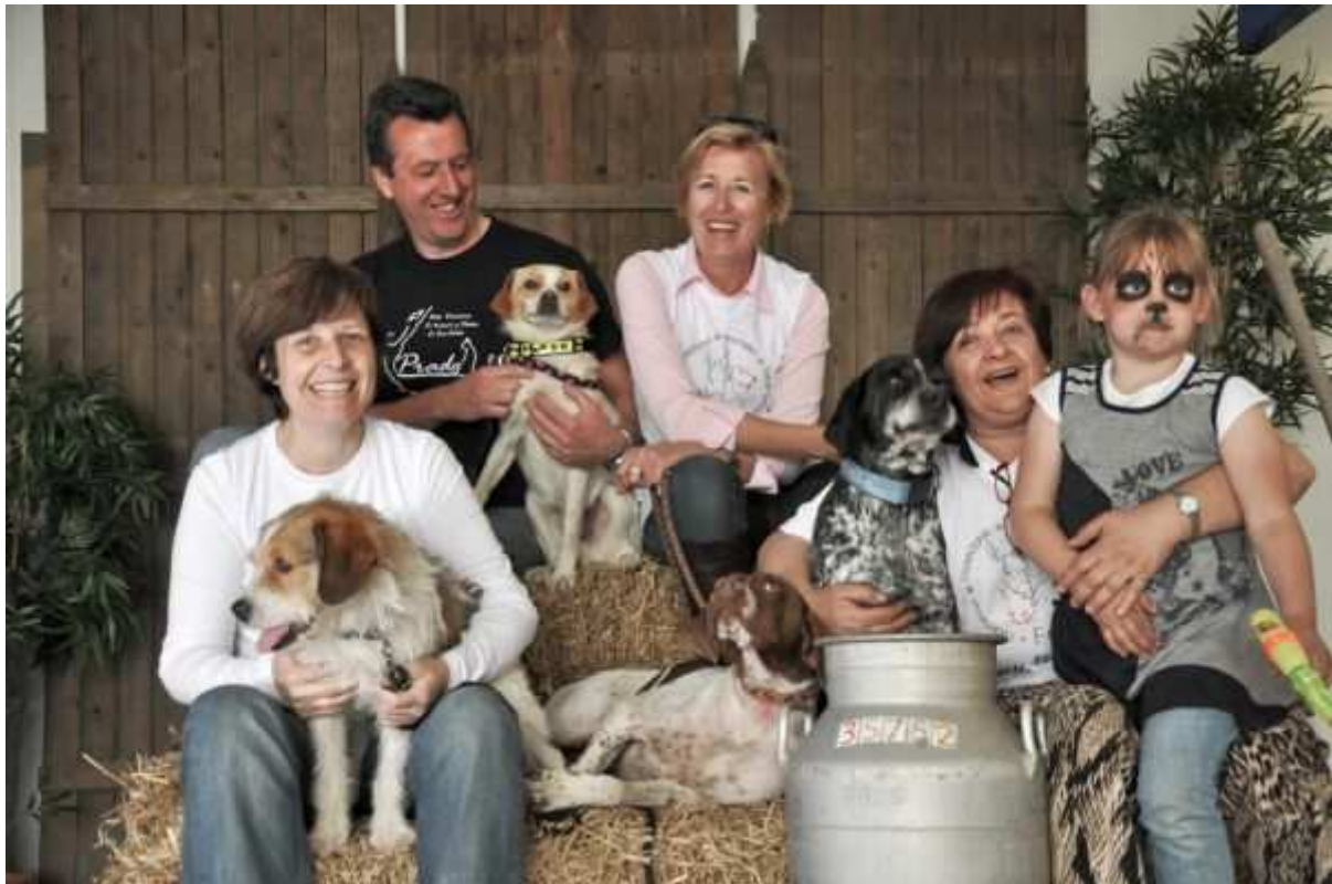
De dames uit Spanje waren er ook met honden vlnr: Gomez, Priko, Santo en Yago.

Het was een groot succes, met name wat betreft de belangstelling voor de hondjes. Daarnaast was de omzet ook niet mis. Dit kwam met name door de bierkraam, de hamburgers, de verkoop en vooral het maken van de wonderbaarlijk mooie foto's van baasjes met hun hondjes.