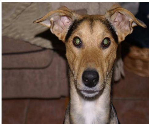
Mijn eigen Nemo