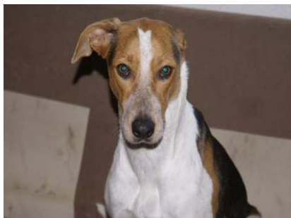
En Bella (Trufa)

Rust zacht lieverds en veel plezier bij de regenboogbrug.